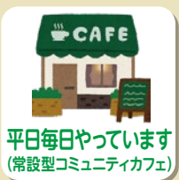
平日毎日やっています (常設型コミュニティカフェ)