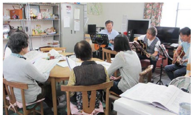
▲仲間とお茶を飲みながら楽しくおしゃべり

生活支援・介護・年金・相続・葬儀など シルバー世代の困ったこと何でもご相談に 応じています(専門家もご紹介しています)