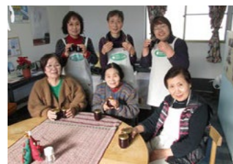
▲ジャム作りなどのイベントも

イベント盛りだくさんで、 笑顔あふれるカフェです 一度遊びに来ませんか？ お待ちしております！