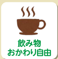
飲み物 おかわり自由