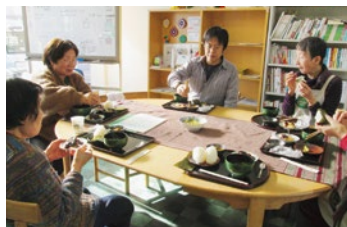
▲みんなでランチを囲んで楽しくおしゃべり

歌声カフェ・ロパク人形劇・歌う紙芝居・カイロプラクティック・マッサージなど楽しく役立つイベントや健康教室などが毎月数多く開催されます。英会話や絵画、パソコン教室など各種講座も開催中。