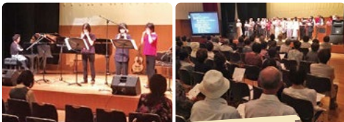
毎年恒例 歌声カフェ Mウイングに180人集まりました