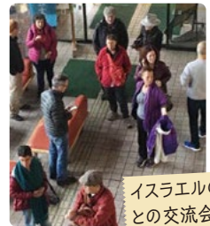
イスラエルの高齢者との交流会・勉強会