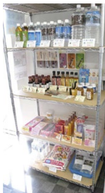
店内の物品棚コーナー▶

野菜や生魚の移動販売や、農家さんからの直産のお米、健康グッズやお役立て用品など、シルバー世代の皆さんに必要なかつ便利な商品を販売しています。