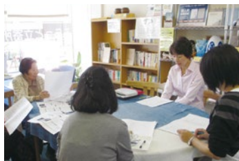
▲楽しく学べる英会話教室(無料)