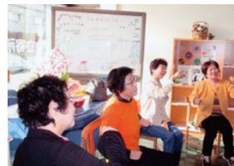
▲いきいき体操でみんな元気に